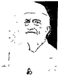
Nehru - a mood